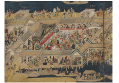
江戸名所図屏風(左隻部分) 江戸時代 重要文化財 出光美術館蔵

会期: 7月28日(土)～9月9日(日) 開館時間: 10:00～17:00 (会期中の金曜日は19:00まで)