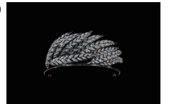
フランソワ=レニエール・ニト《妻の穂のティアラ》1810-11年頃 ゴールド、シルバー、ダイヤモンド ショーメ・コレクション、パリ

会期: 6月28日(土)～9月17日(月・祝) 開館時間: 10:00～18:00 (会期中の金曜日は21:00まで)