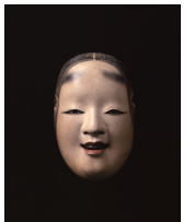
雪の小面 龍右衛門作 金剛家蔵

会期: 6月30日(土)～9月2日(日) 開館時間: 10:00～17:00 (会期中の金曜日は19:00まで)