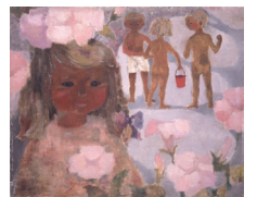
いわさきちひろ《ハマヒルガオと少女》1950年代中頃 ちひろ美術館蔵

会期: 7月14日(土)～9月9日(日) 開館時間: 10:00～18:00 (会期中の金曜日は20:00まで)